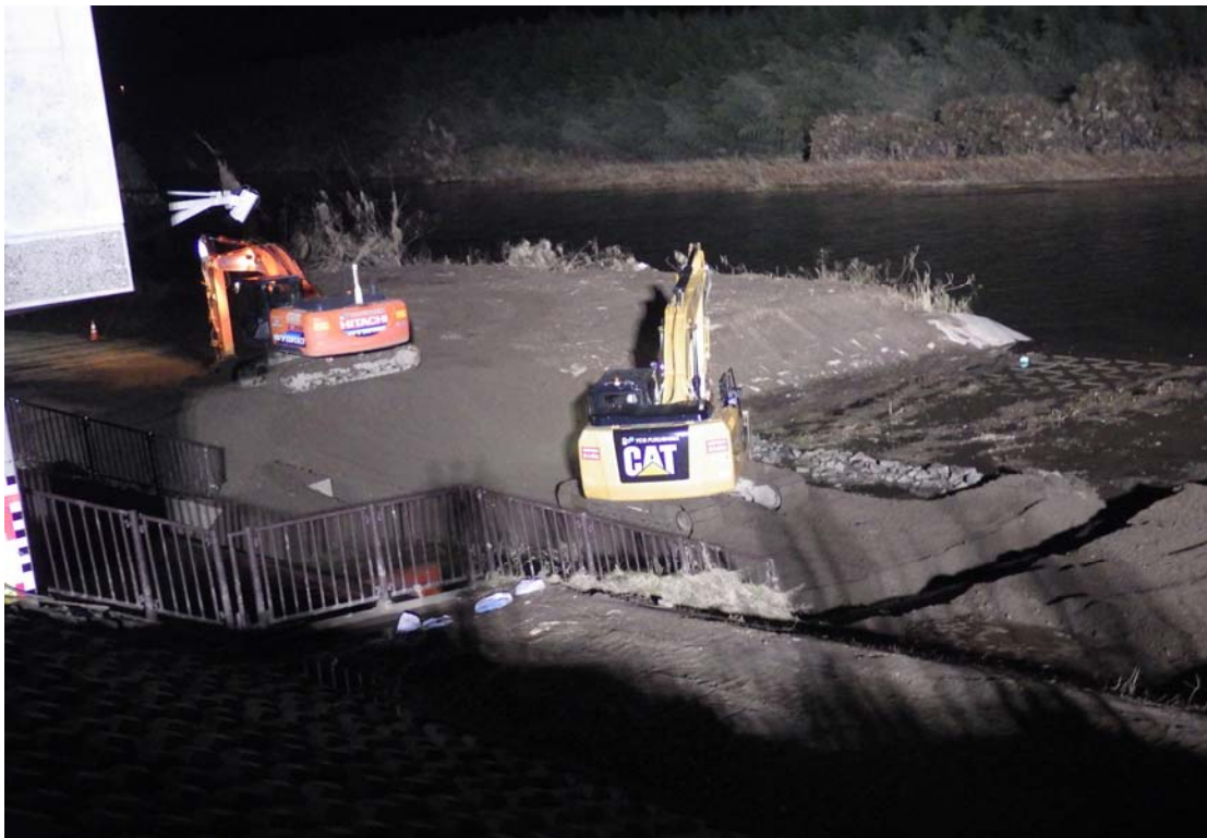
令和元年10月23日夜間 施工ヤードの造成作業状況