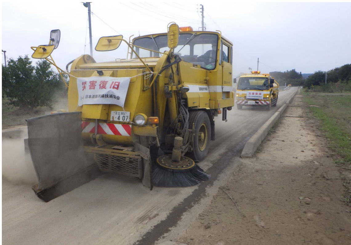
令和元年10月21日 路面清掃車による土砂清掃状況

災害対策車両による、国見町内に流入した土砂の撤去作業実施状況 (於 伊達郡国見町地内)