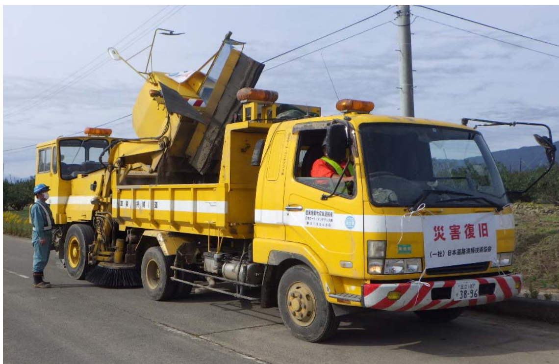
令和元年10月21日 撤去した土砂の運搬状況