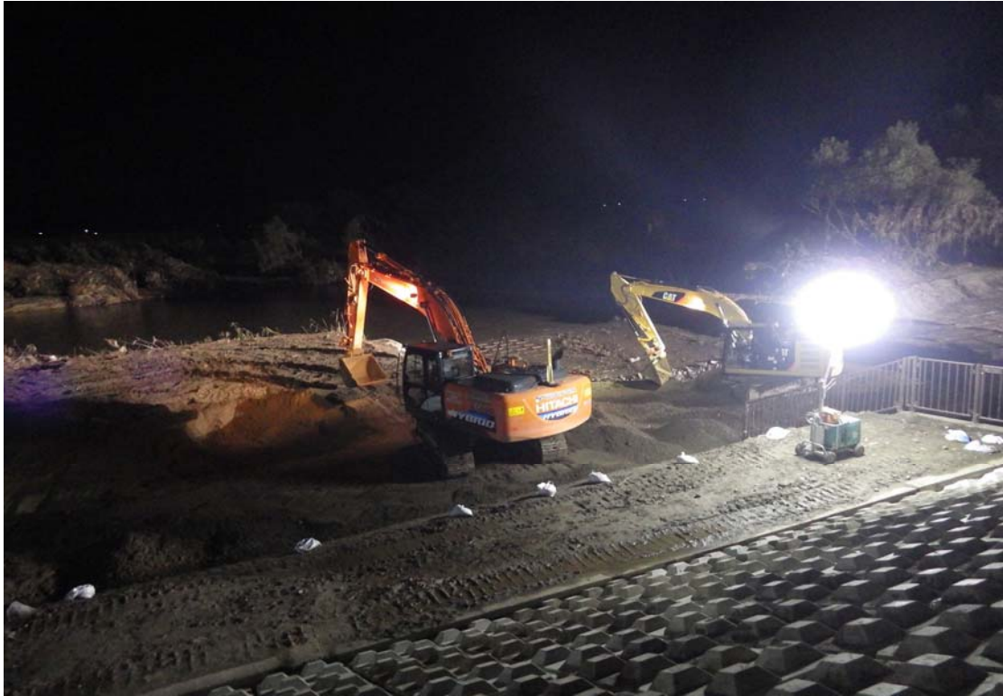
令和元年10月23日夜間 24時間体制での緊急復旧作業状況