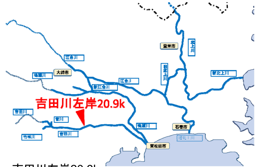
吉田川左岸20.9k 宮城県黒川郡大郷町粕川字田三郎地先