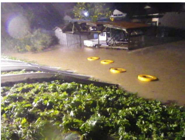
①善川 内水排水作業中