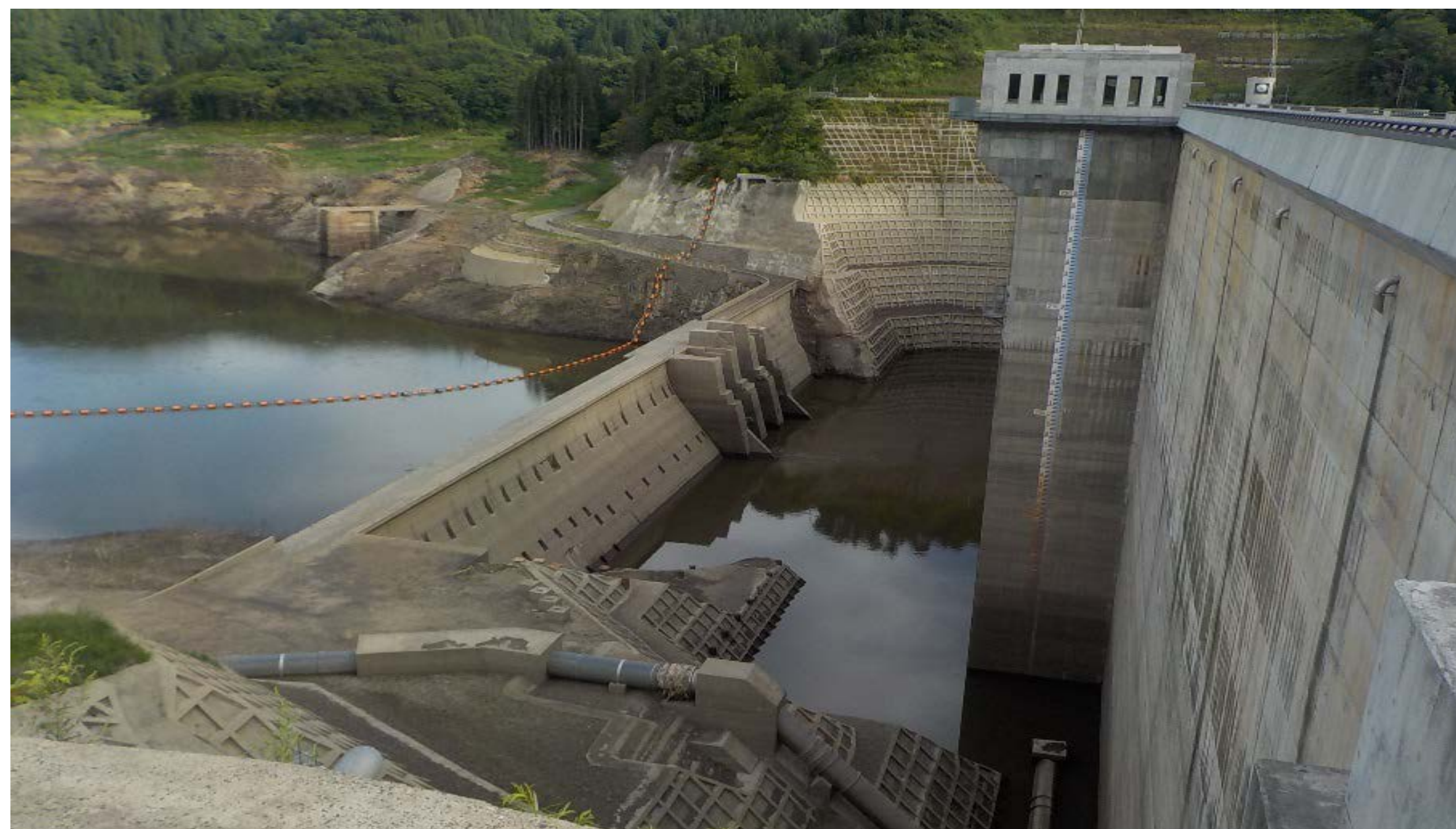
■ 管理移行後、一番低い貯水位となった津軽ダム (R元. 8. 16 8時30分撮影)