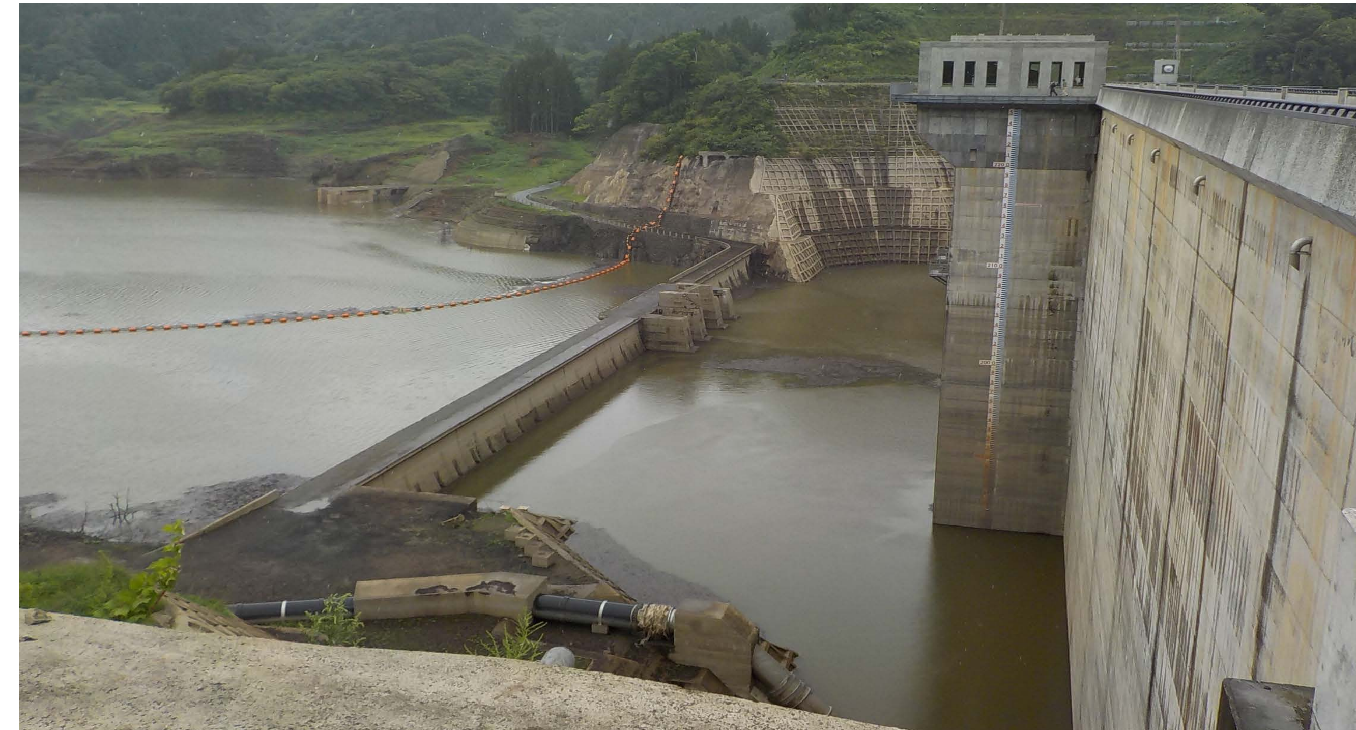
■ 貯水位が回復した津軽ダム (R元. 8. 23 12時頃撮影)