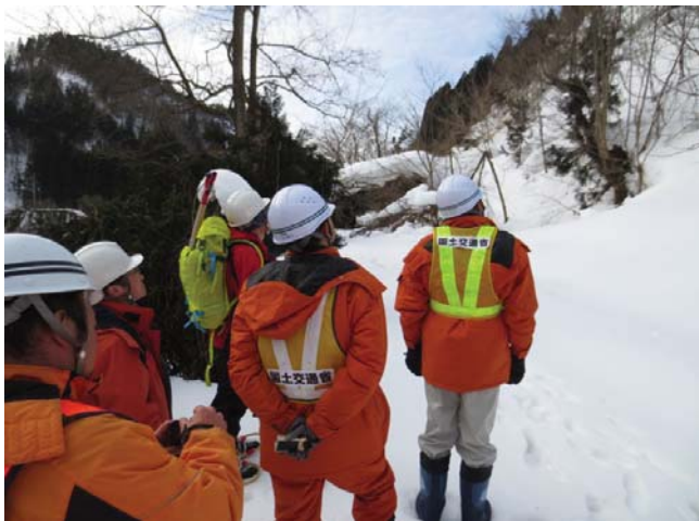
▲専門家による現地調査実施状況①