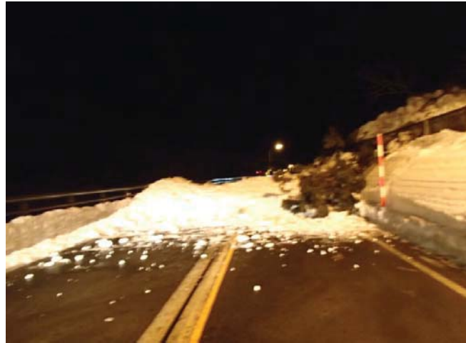
▲雪崩直後の道路状況