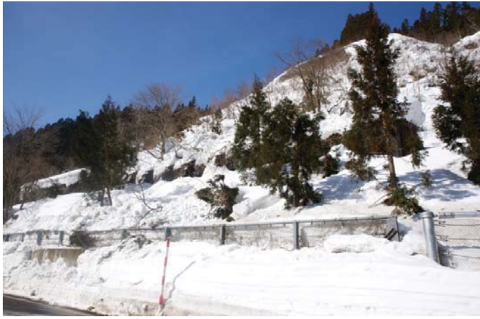
▲雪崩発生箇所の法面状況