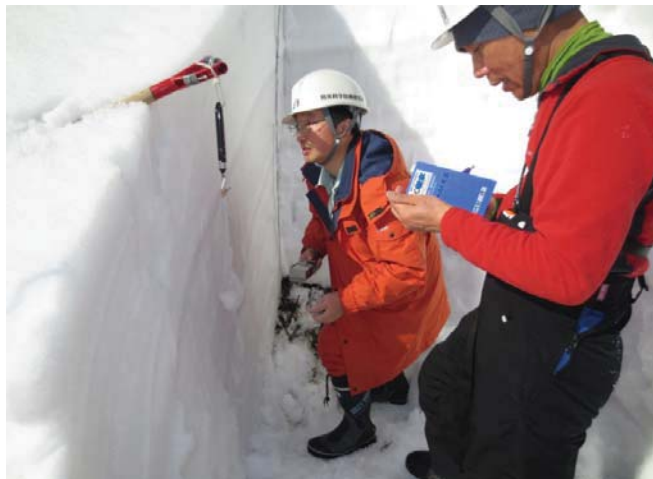
▲専門家による現地調査実施状況②