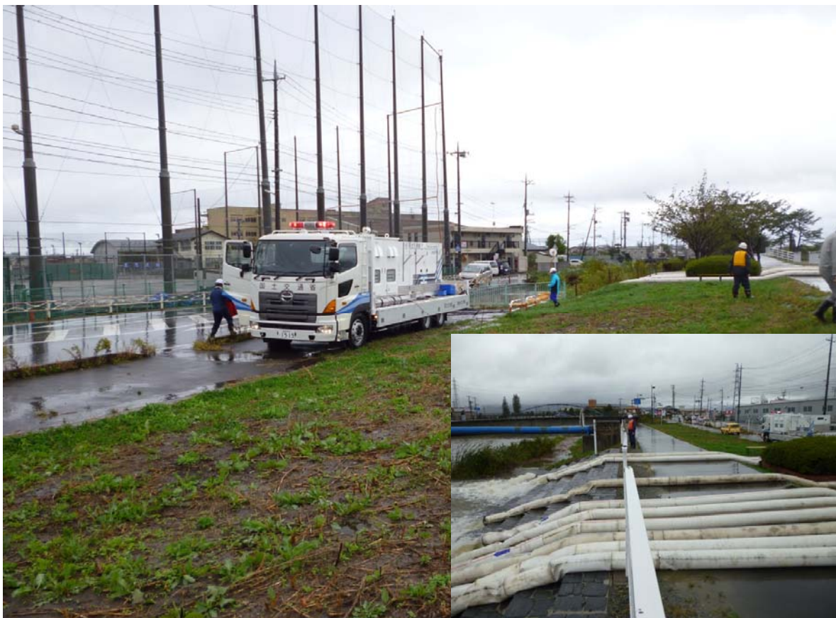
横堤ポンプ場（石巻市貞山地内）【排水ポンプ車 30m 3 /分】