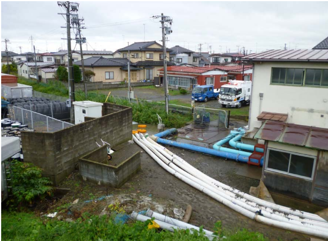
眼鏡筒ポンプ場（石巻市蛇田地内）【排水ポンプ車 30m 3 /分】