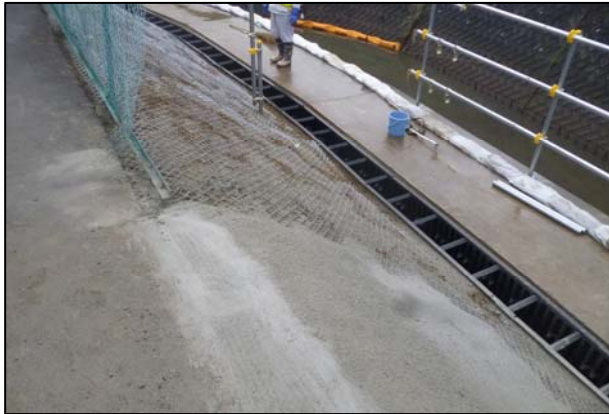
(モルタル吹付実施状況)