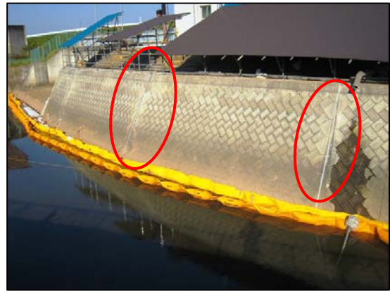
(護岸目地閉塞状況)