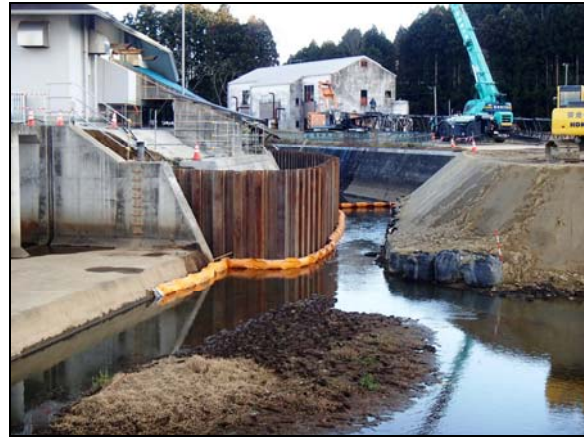
(鋼矢板打込み完了：上流側)