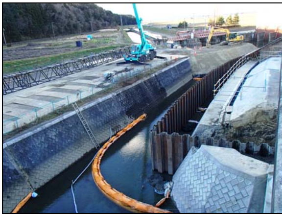
(鋼矢板打込み完了：下流側)