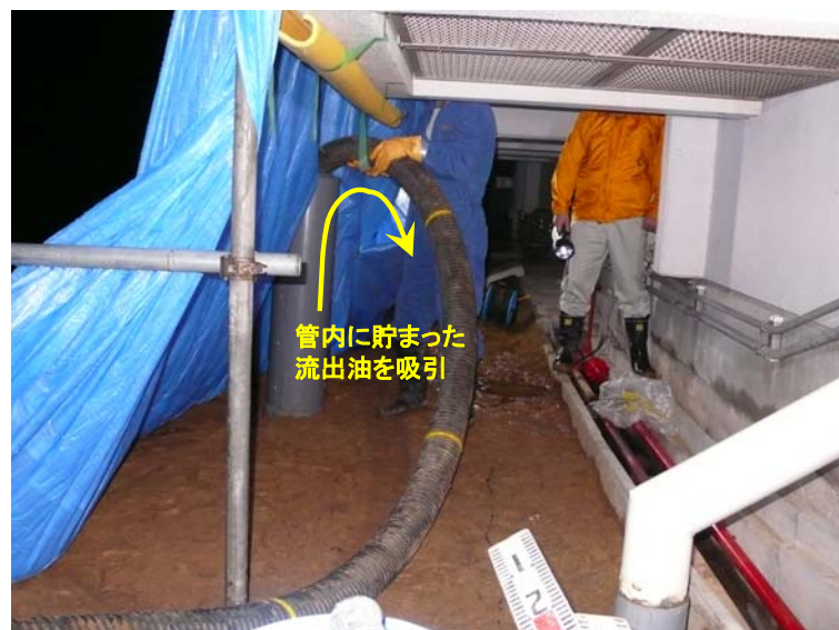
流出油の回収作業状況