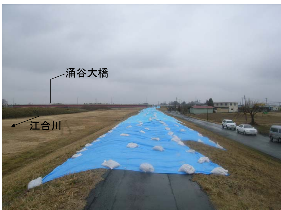
江合川 左岸 涌谷町涌谷(14.4k付近)応急対策後 3月15日 シート張り完了