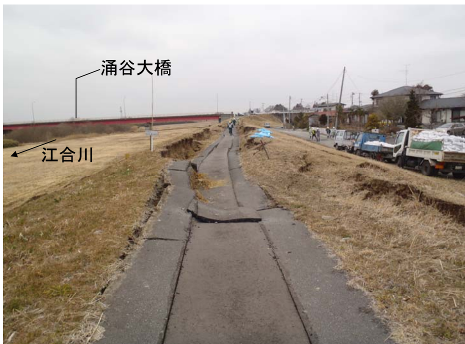
江合川 左岸 涌谷町涌谷(14.4k付近)被災直後 堤防の亀裂と沈下