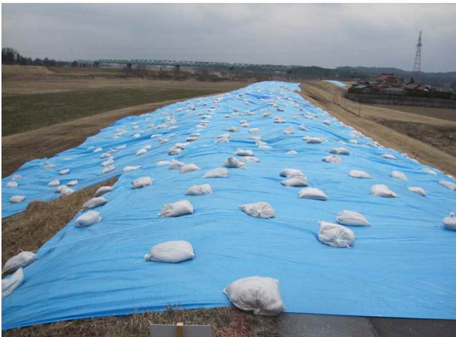
鳴瀬川 右岸 大崎市三本木齊田(40.0k~40.1k)応急対策後 3月15日 シート張り完了