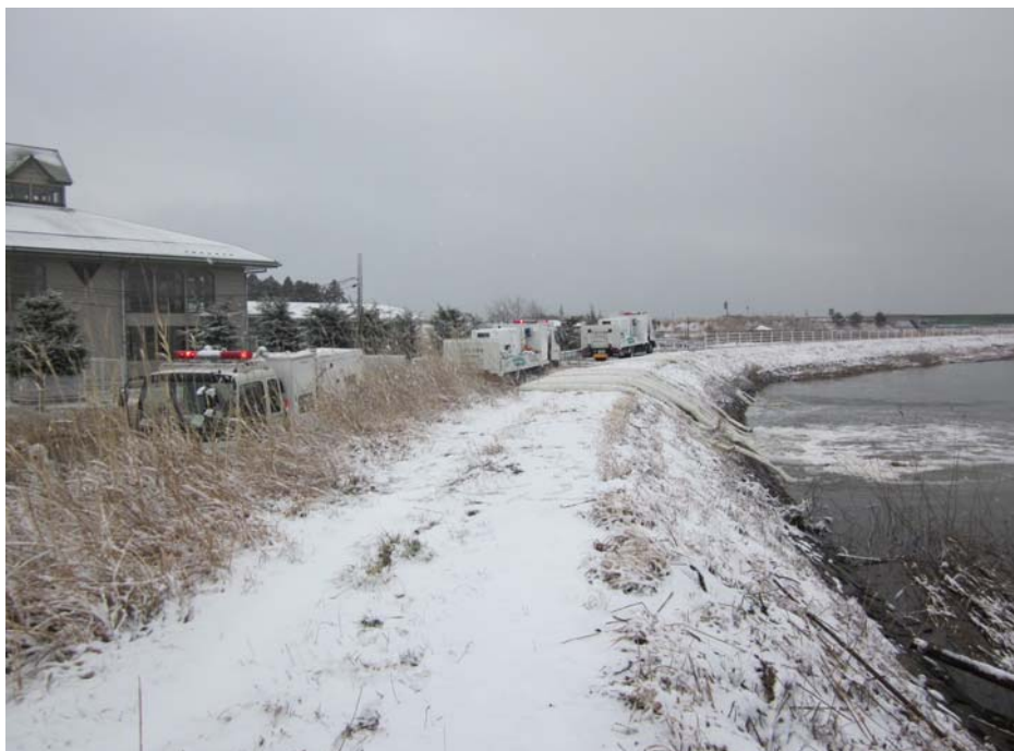
3月17日 東松島市赤井地区の浸水解消のための排水作業