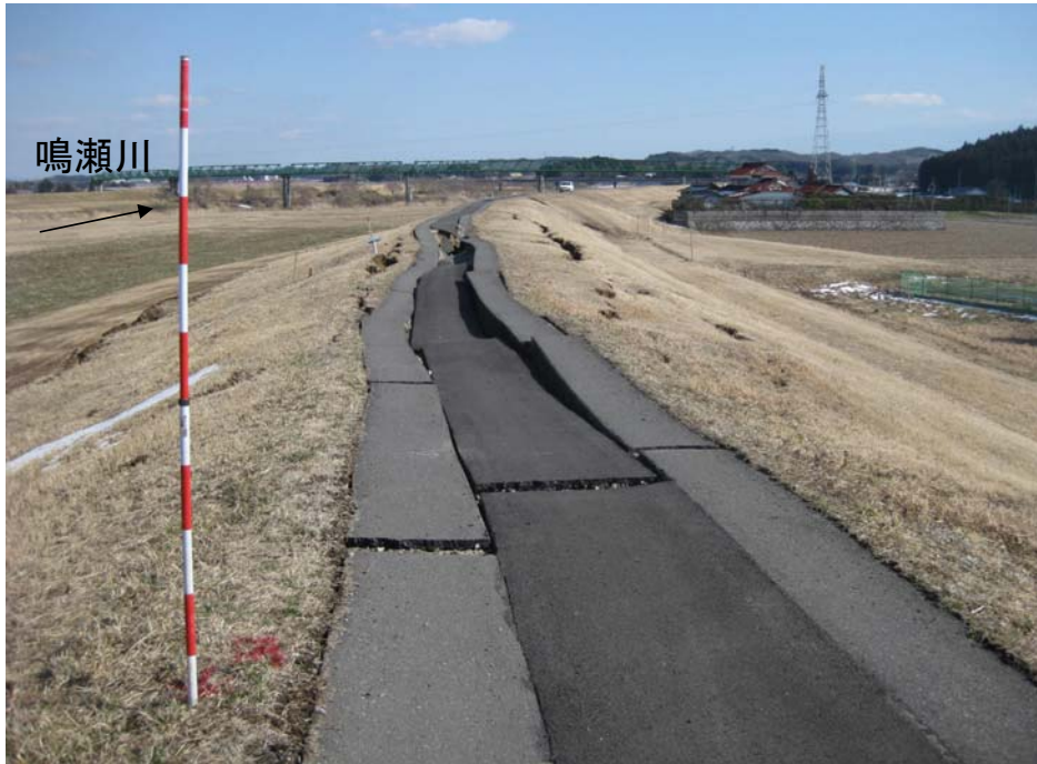
鳴瀬川 右岸 大崎市三本木齊田(40.0k~40.1k)被災直後 堤防の亀裂と沈下