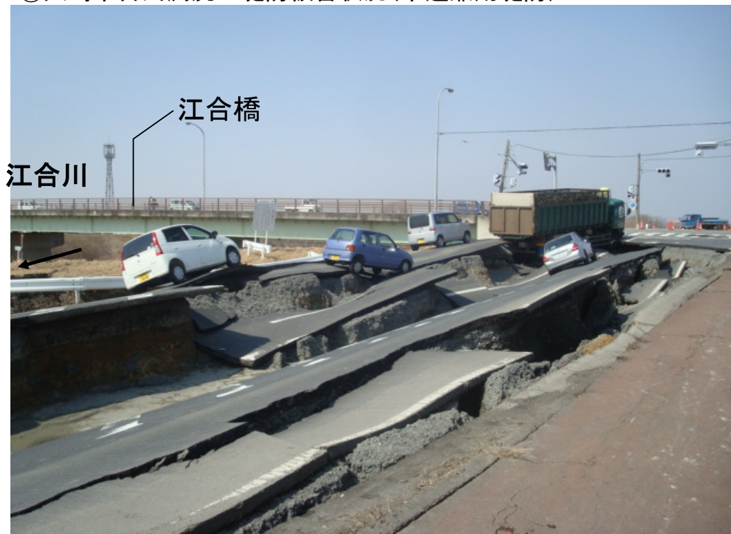
江合川左岸27.6k付近(堤防亀裂・沈下)