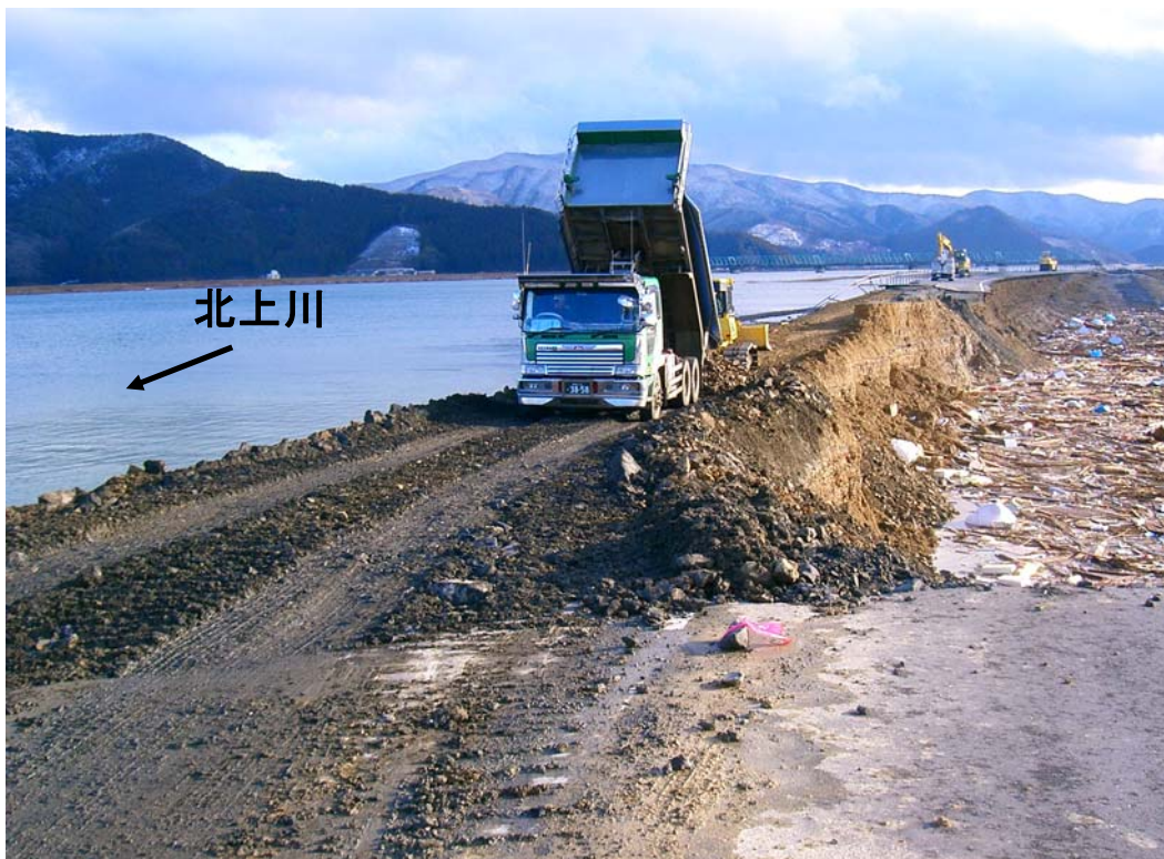
平成23年3月16日16時頃 荒締め切り作業状況