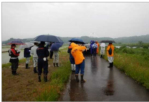
川口・上大淵堤防