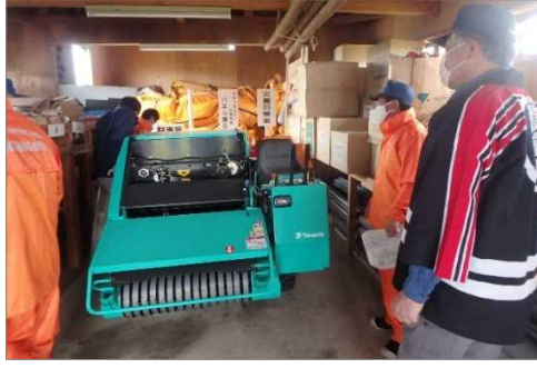
真室川水防資材倉庫