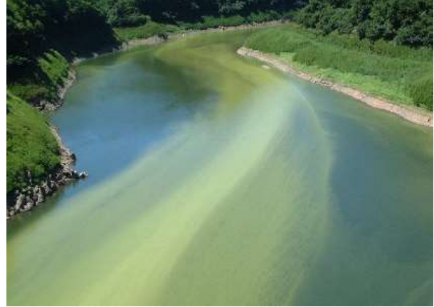
② 平成12年9月頃撮影(田瀬大橋付近)