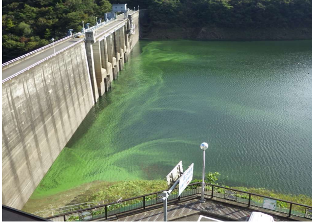
① 令和5年10月頃撮影(ダムサイト付近)