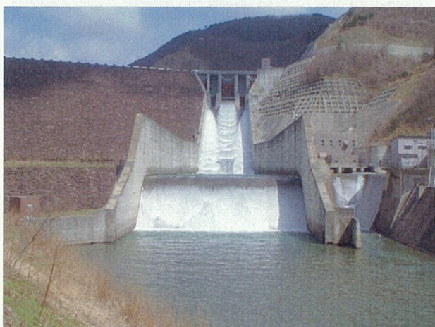
4月28日 (下流からの撮影) 貯水位 EL293.71 m 放流量 5.04 m 3 /s