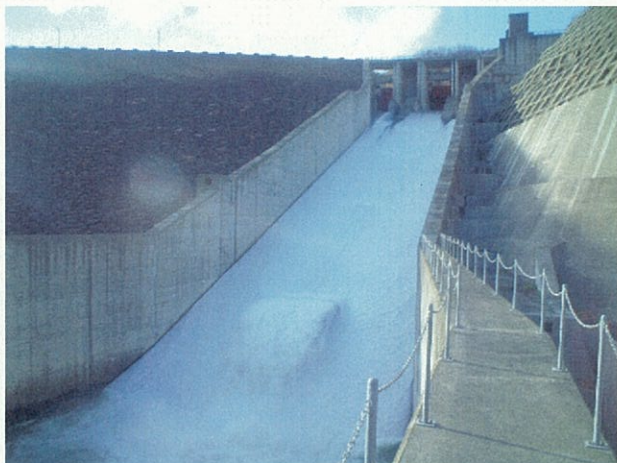
4月21日 (洪水吐から撮影) 貯水位 EL294.01 m 放流量 19.05 m 3 /s

期間中の最高水位は5月2日でEL. 294.06m。ゲートからの最大放流量は、同日で21.93m 3 /sでした。