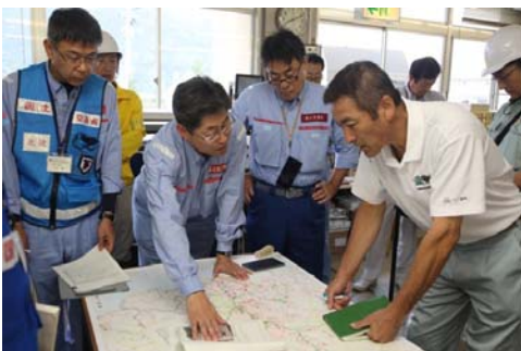
▲ 自治体への技術的支援