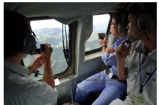
▲ 防災ヘリによる被災状況調査