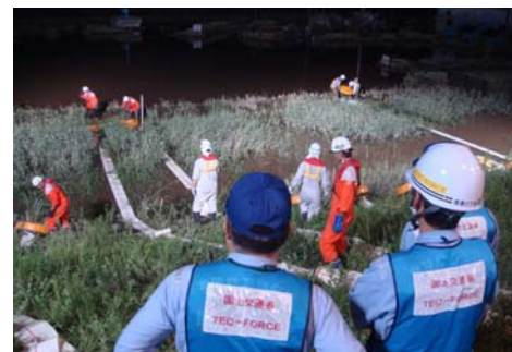
▲ 排水ポンプ車による排水活動