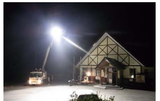
▲ 避難所への照明車設置