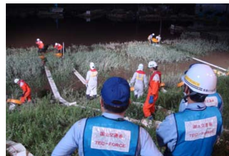
▲ 排水ポンプ車による排水活動