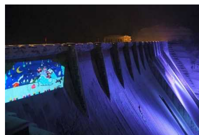
【津軽ダム_クリスマスライトアップ2022】