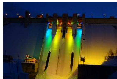
【浅瀬石川ダム_クリスマスライトアップ2022】