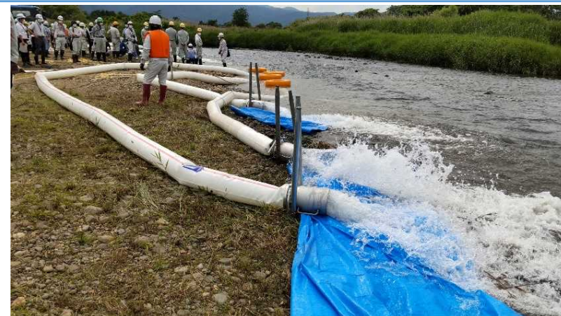
訓練状況(排水作業)