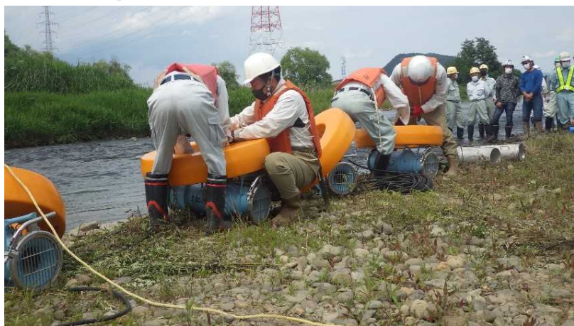
訓練状況(ポンプ設置)