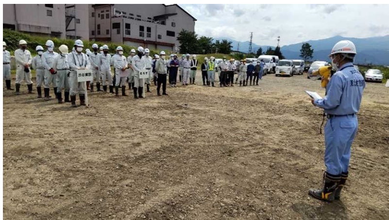
福島河川国道事務所からの訓練説明