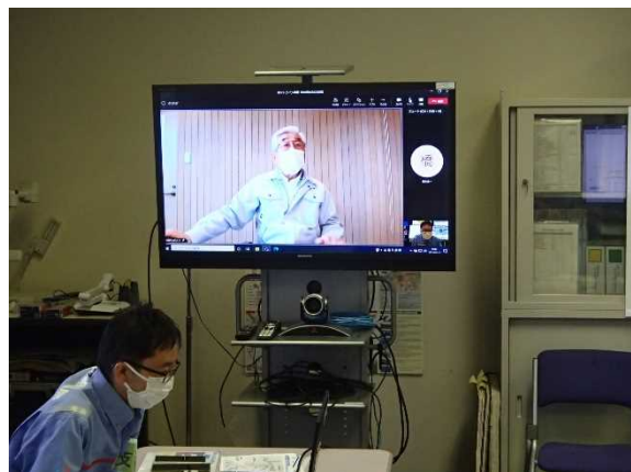
ホットラインによる情報伝達の状況