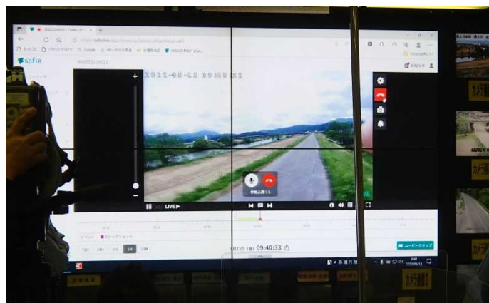
ウェアラブルカメラを用いた被災状況画像伝送