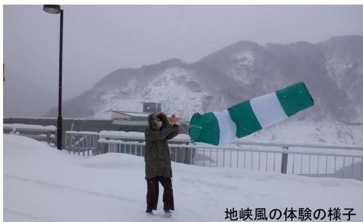
地峡風の体験の様子