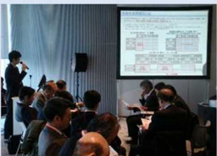
包括的民間委託等の民間活用 の取組み事例の紹介