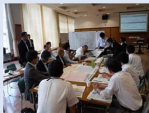
個別施設計画の策定・実施の課 題解決につながるアイデア紹介