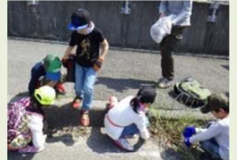
地域一体の取組みへの サポート