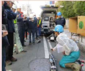
新技術導入の検討の現場試行 の調整