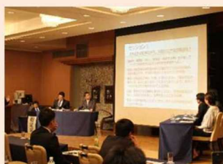
技術者の確保や育成に関する 各地での取組み紹介