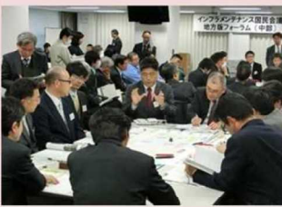
メンテナンスの課題を解決する 技術等の紹介や技術マッチング