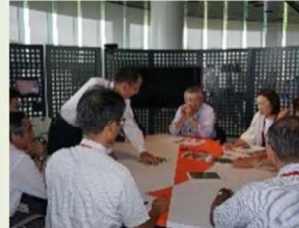
各地の地域によるメンテナ ンス活動の紹介