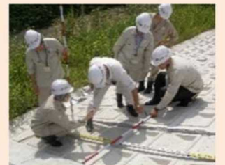
地域における技術者派遣の 仕組みづくりの支援