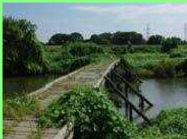
ピオトープの整備