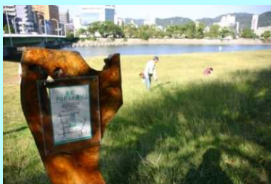
市民団体による看板設置事例（太田川）