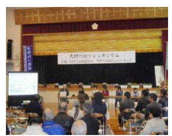
シンポジウムの開催