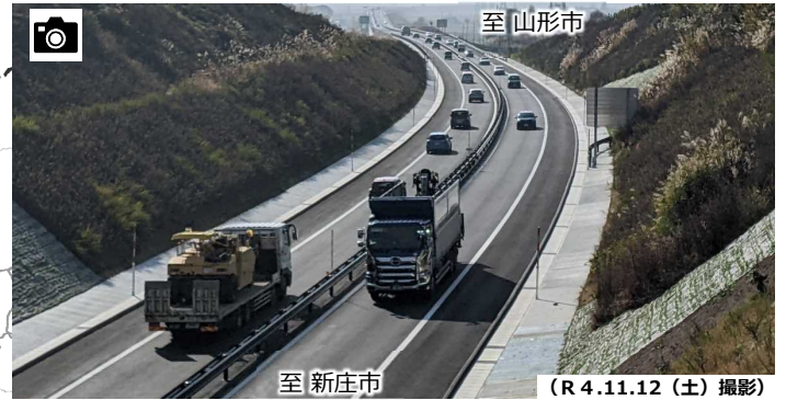
▼東北中央自動車道及び国道13号の交通状況

交通量 ■ : 断面交通量 ■ : 東北中央自動車道交通量 ■ : 国道13号交通量 変化 ■ : 増加 ■ : 減少