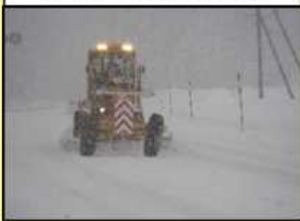
除雪グレーダによる作業状況