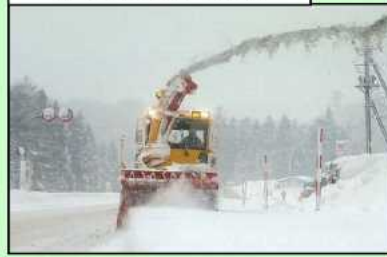
ロータリ除雪による作業状況