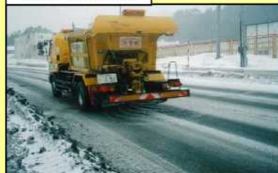
散布車による散布状況