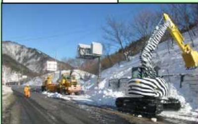
バックホウによる除去状況