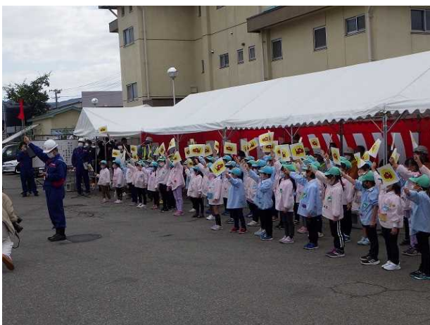
園児による除雪車始動命令