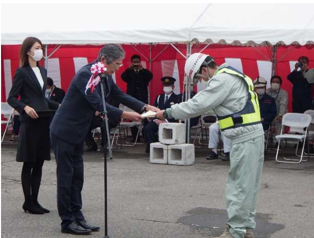
除雪従事功労者表彰