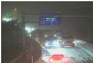
会津坂下町塔寺付近