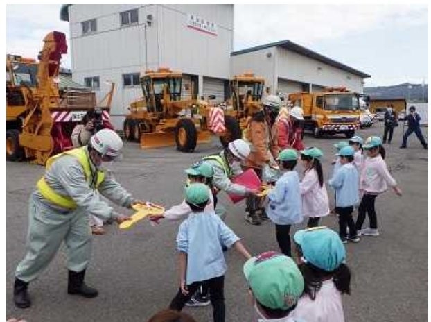
園児による除雪機械の鍵の引き渡し