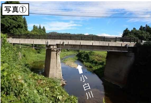
被災前の大巻橋の状況