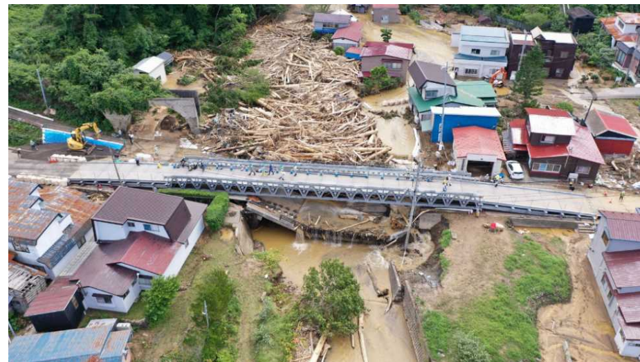
▲応急組立橋設置状況