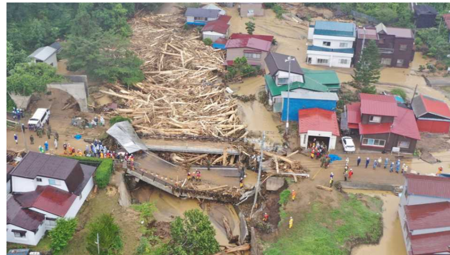
▲令和3年8月の大前による被災状況