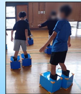
洪水氾濫疑似体験 (防犯長靴を用いた体験)