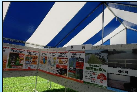
水防災パネル(昭和三十九年洪水(羽越水害)等)