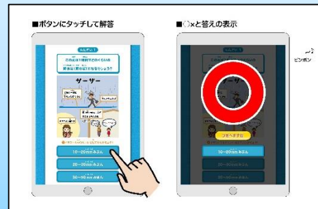
雨の強さに関するクイズゲーム