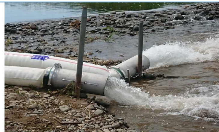
訓練状況(排水作業)