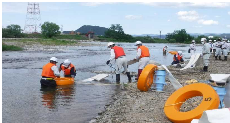
訓練状況(ポンプ設置)