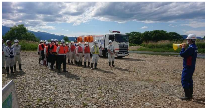
福島河川国道事務所からの訓練説明