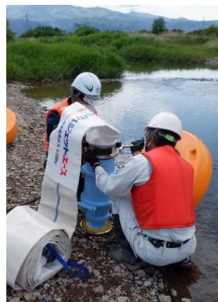
訓練状況(ホース設置)