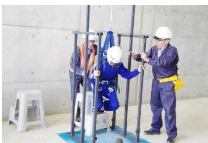
フルハーネス安全帯の着用体験