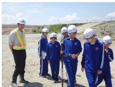
人工衛星を利用した測量体験