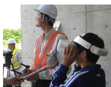
UAV飛行映像視覚体験