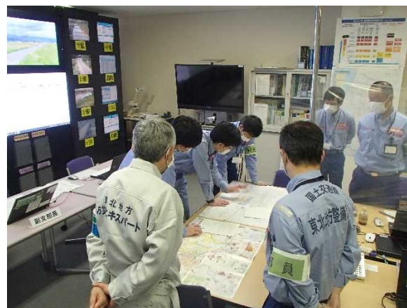
復旧工法検討の状況