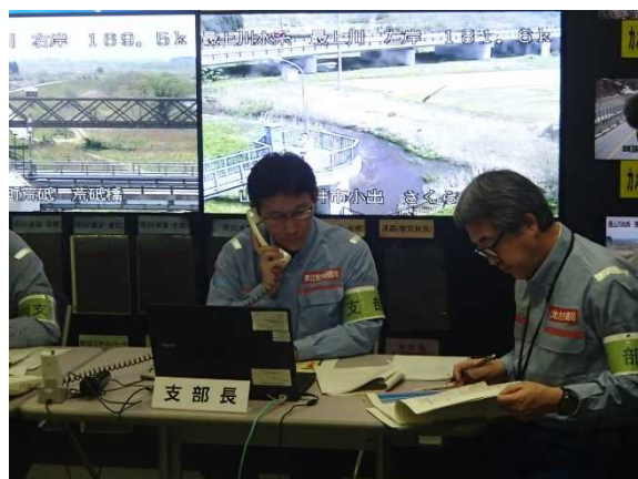
ホットラインによる情報伝達の状況