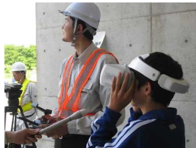
ドローン飛行映像視覚体験