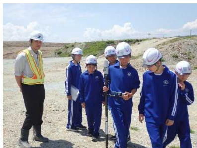
人工衛星を利用した測量体験