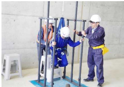
フルハーネス安全帯の着用体験