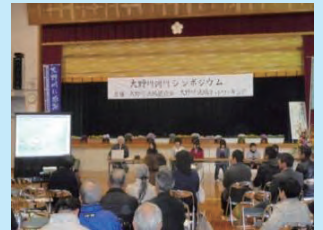
シンポジウムの開催