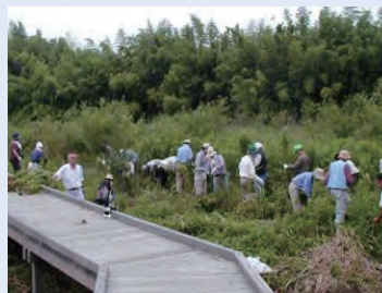
ビオトープの整備