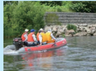
船による河岸の情報収集等