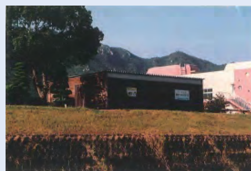
市民団体による活動拠点の整備事例 (佐波川)