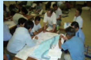
マイ防災マップづくり