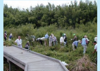
ビオトープの整備