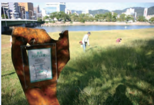
市民団体による看板設置事例 (太田川)

これらの河川法上の許可等について、河川管理者との協議の成立をもって足りることとなります。