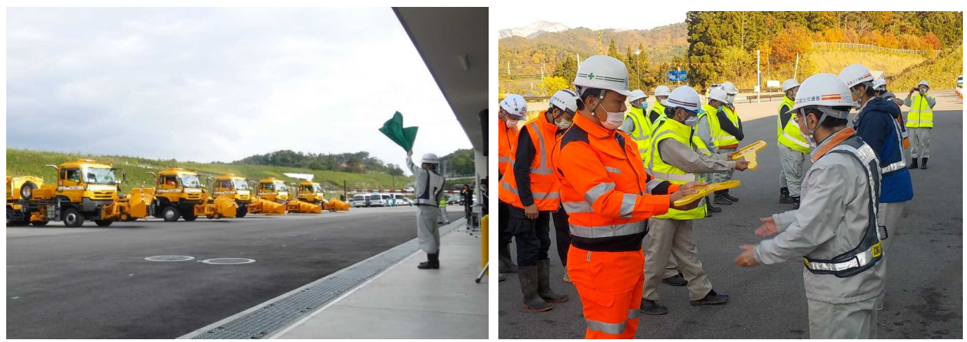
【過去の除雪状況の様子】