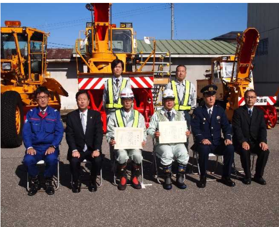
除雪従事功労者表彰