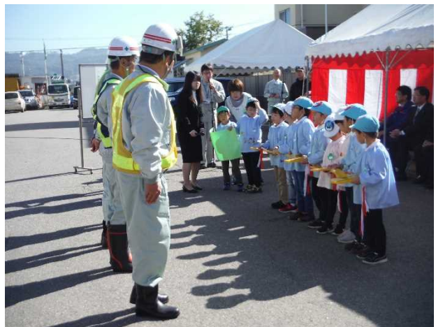
園児による除雪機械の鍵の引き渡し