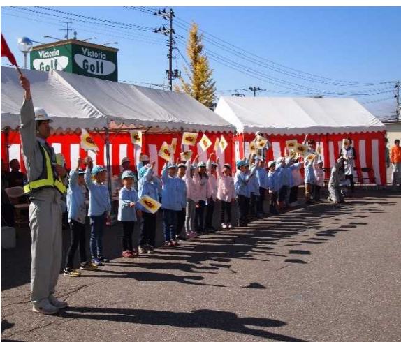
園児による除雪車始動命令