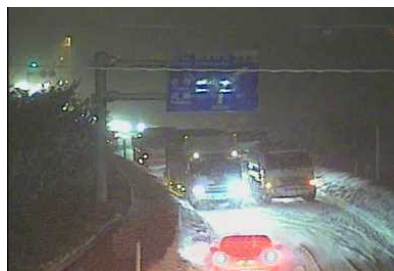
会津坂下町塔寺付近