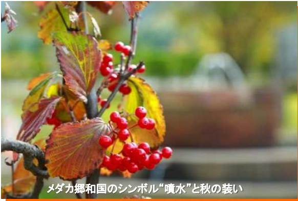
メダカ郷和国のシンボル“噴水”と秋の装い

「共生の郷 メダカ郷和国」は2002年（平成14年）一般国道7号青森環状道路整備の際に、周辺に生息していた絶滅危惧種に指定されているメダカを保護し、生息空間を確保するために造られたビオトープになります。