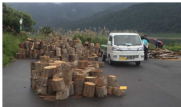
<流木提供状況(昨年の積み込み状況)>