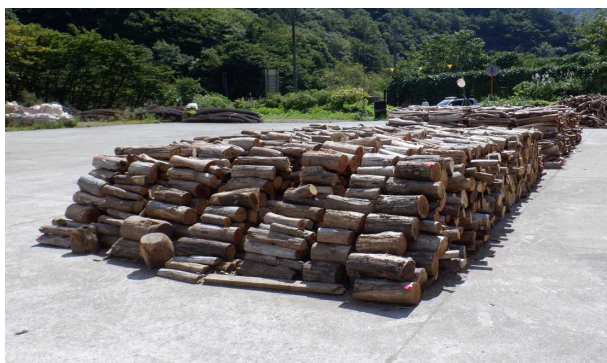
<今年の流木提供全体量>