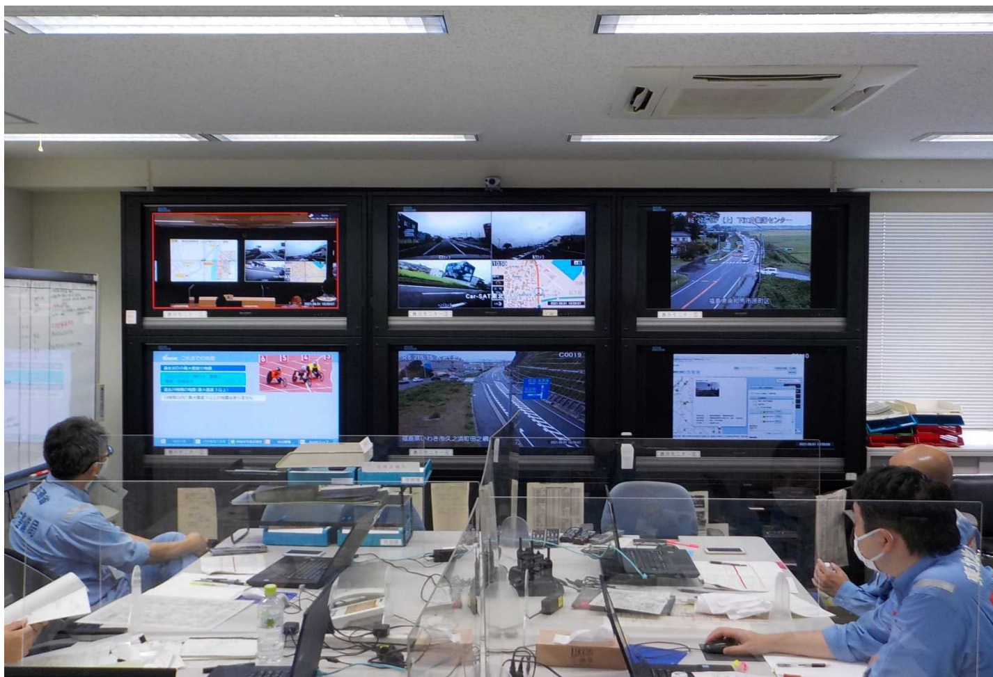
アクリル板の設置による感染対策を講じながら、訓練を実施(モニター上段真ん中はCar-SATの映像)