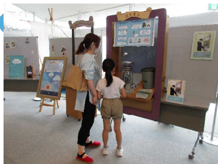
北上川学習交流館あいぽーと

しとしとした梅雨は好きですが最近では梅雨明け前の豪雨が増えてきたと感じます。めぐみの雨とキケンな雨、本当にそうだなあと感じました。事前の準備、いざというときの判断、大切と思いました。楽器癒やされました。