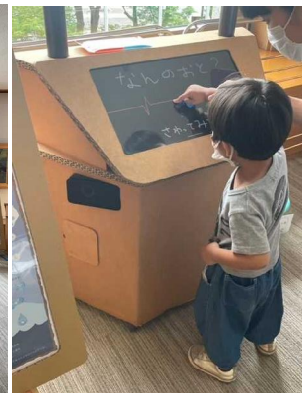
山形県生涯学習センター遊学館