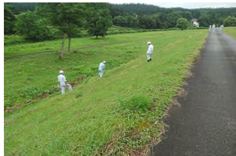
堤防に変形や亀裂などの異常が無いかを目視で点検しています。