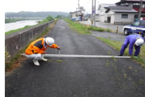
堤防天端に発生した亀裂などの状況を点検しています。