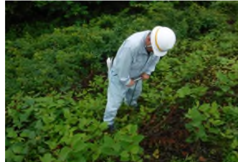
裸地化の原因となるイタドリが群生している箇所を点検し、貫入棒を使用して堤防の強度を調査しています。