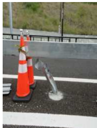
▲中央分離帯の損傷イメージ