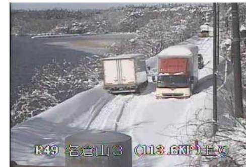
【国道49号猪苗代町の状況】