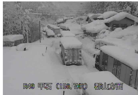
【国道49号西会津町の状況】