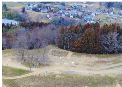
【桑折西山城跡上空写真】

桑折西山城跡入口 Koori Nishiyama Castle Ruins Ent.