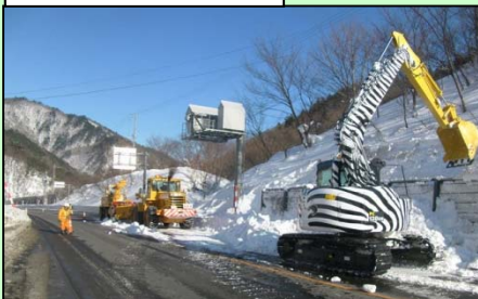
バックホウによる除去状況