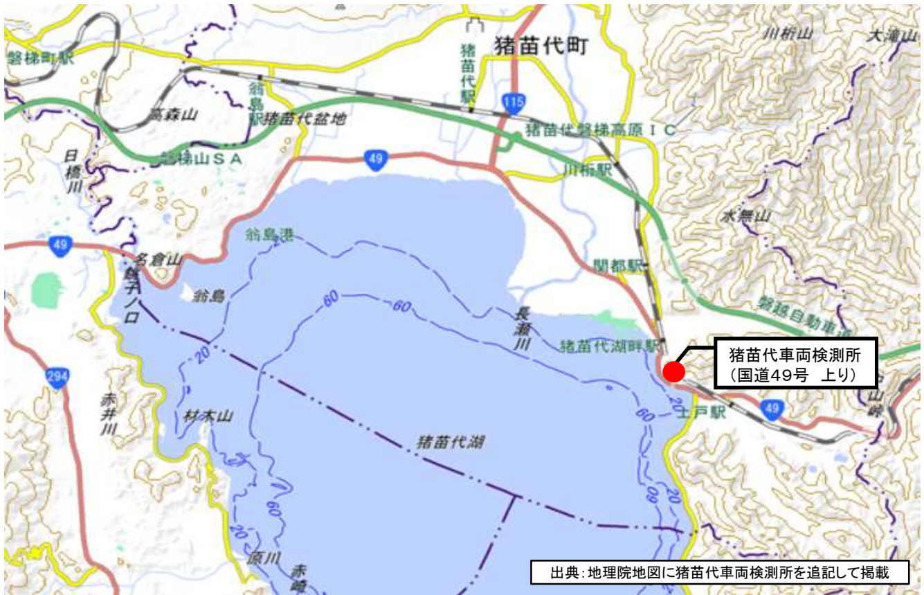
猪苗代車両検測所：耶麻郡猪苗代町大字山潟字出戸墓目地内