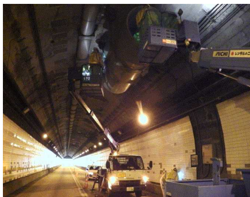
▲換気設備（ジェットファン）点検イメージ

実際に放水する試験や換気設備の吊り金具の打音点検を行うことにより、一般交通に支障をきたすため今回全面通行止めを行います。