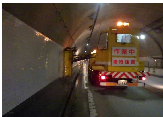
▲トンネル壁面清掃イメージ