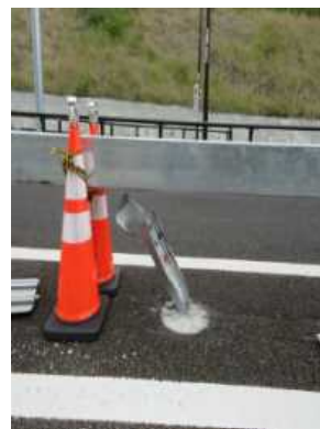
▲中央分離帯の損傷イメージ