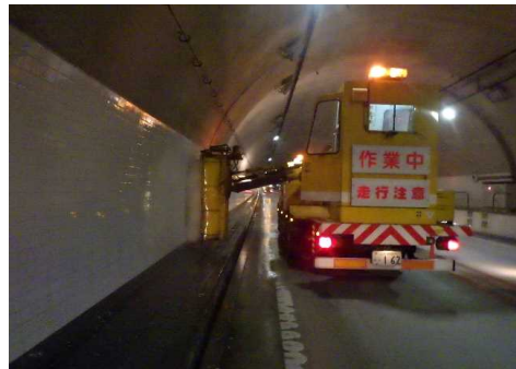
▲トンネル壁面清掃イメージ