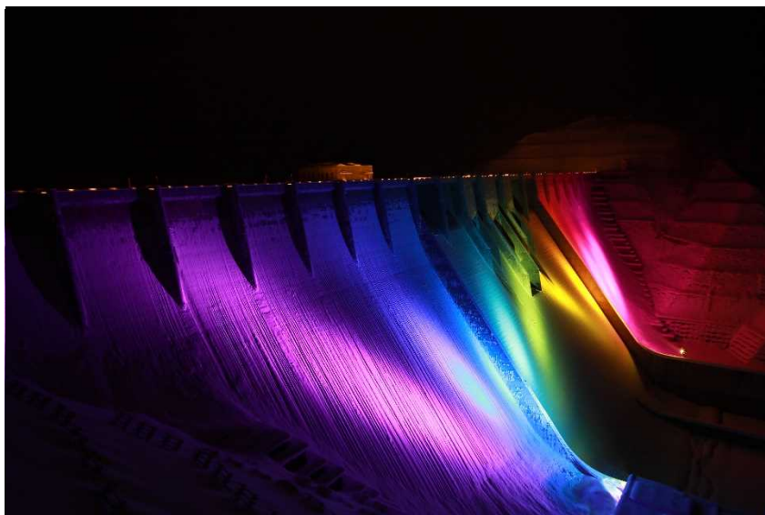
春のライトアップ 津軽ダム