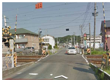
自動車練習所踏切