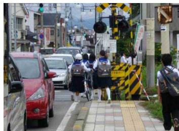
第4喜多方街道踏切