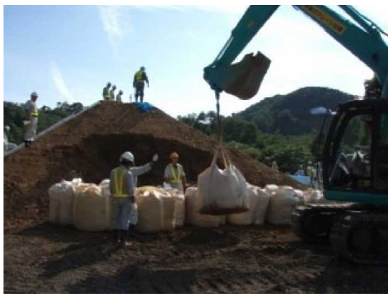
大型土のう積みを実践