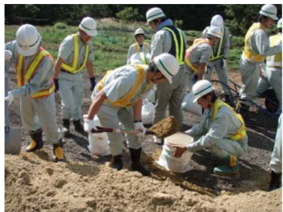
国土交通省職員も土のうを製作