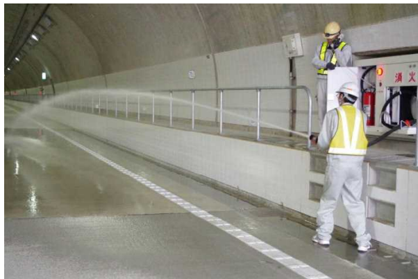
▲消火栓設備点検試験イメージ

消火栓から実際に放水する試験や換気設備の吊り金具の打音点検を行うことにより、一般交通に支障をきたすため今回全面通行止めを行います。