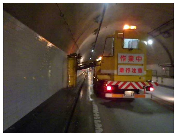
▲トンネル壁面清掃イメージ