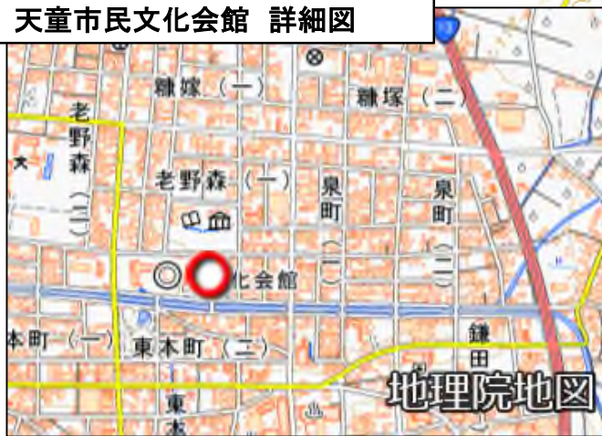
天童市民文化会館 詳細図