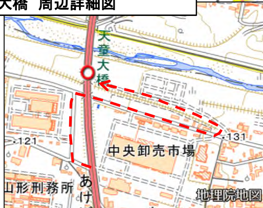
天童大橋 周辺詳細図